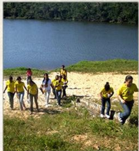
Passeio Cultural Aula de Ciências no Parque de Pituvaçu

Cultural Field Trip Science class at Pituvaçu Park