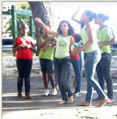
Chegada da Primavera Brincadeiras na Praça

Visit from Social Services Inservice about violence in the schools