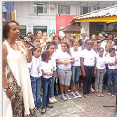
Dia do Professor Apresentação do Coral na Associação dos Professores

Visit to Sarah Hospital Lecture about prevention of accidents