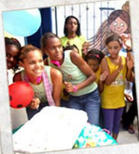
Festa das Aniversariantes do Mês de maio