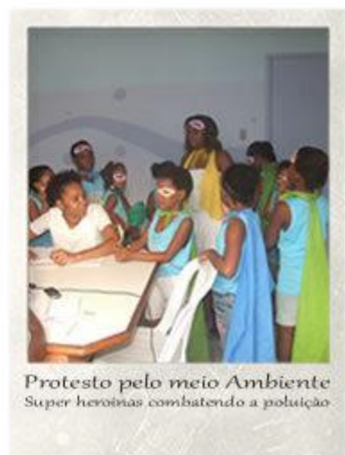
protest in favor of the enviroment