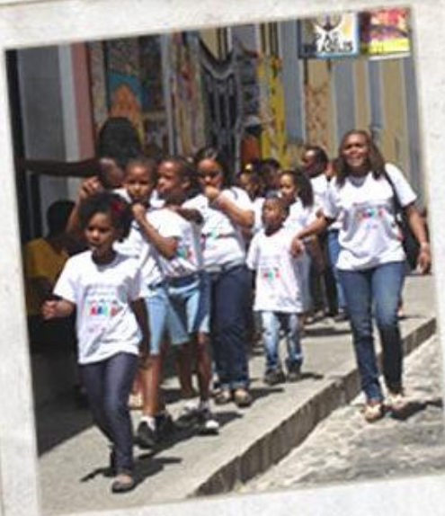
Aula de Campo, Geografia e História Resignificando a cidade de Salvador

Application of fluoride Visit to the Health Center of Gamboa