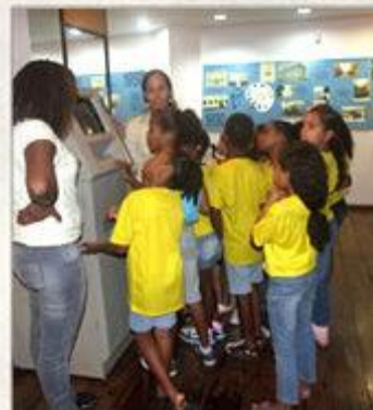
Passeio Cultural Museu Eugênio Teixeira Leal

Lecture about the Human Body and Sexuality