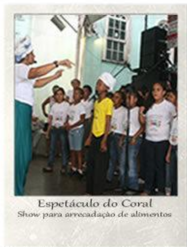
Special Presentation of the Choir Benefit to collect food for the school Pedro Arcanio Sauear