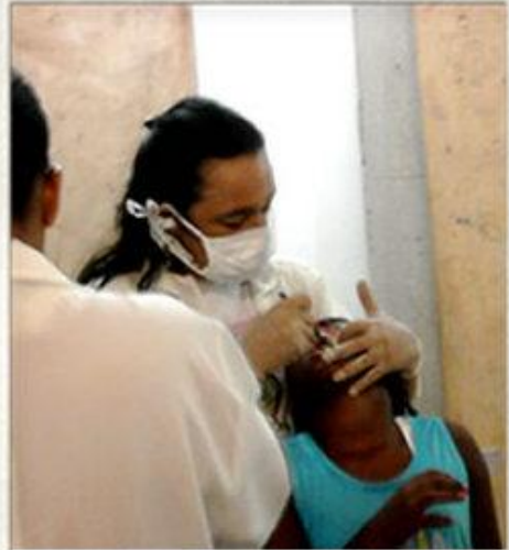
Aplicação de Fluor Visita ao Posto médico da Gamboa

Application of fluoride Visit to the Health Center of Gamboa