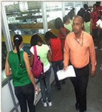
Aula de Campo de Português Visita ao Jornal a Tarde

Class Practice, Reading and Writing Visit to The Newspaper - A Tarde