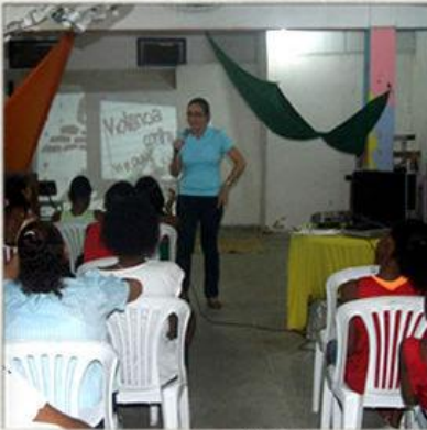
Visita do Conselho Tutelar Palestra sobre violência na Escola

Visit from Social Services Inservice about violence in the schools