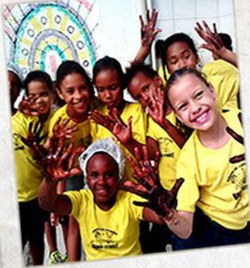
ChocoAula Curso de Chocolate