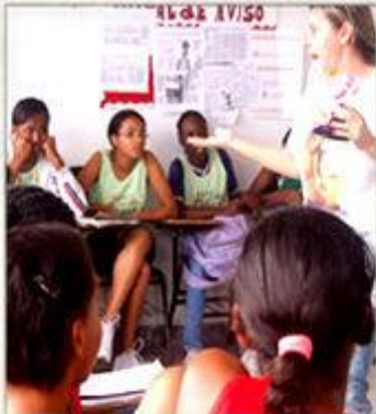
Palestra sobre Corpo e Sexualidade

Class Practice, Reading and Writing Visit to The Newspaper - A Tarde