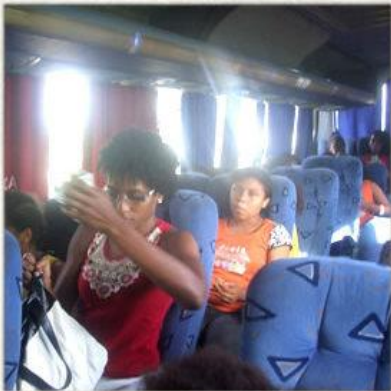
Visita ao Hospital Sarah Palestra sobre prevenção de acidentes

Visit to Sarah Hospital Lecture about prevention of accidents